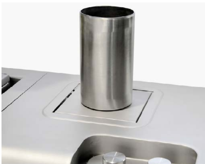
75-PV5X150 gilza na zintegrowanej wadze w modelu 75-PV50A25