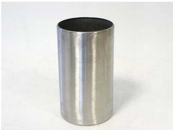
75-PV5X150 Gilza wirówki