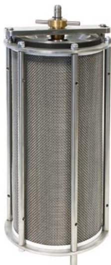
75-PV5X010 Kosz ekstraktora z 75-PV5X040 deklem