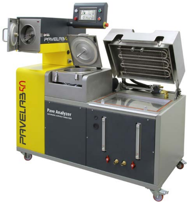
Ekstraktor ultradźwiękowy z otwartą komorą