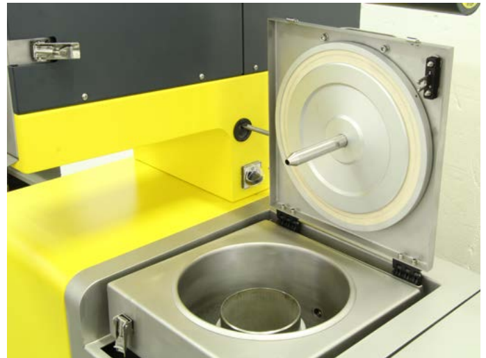
Widok wirówki wraz z gilzą