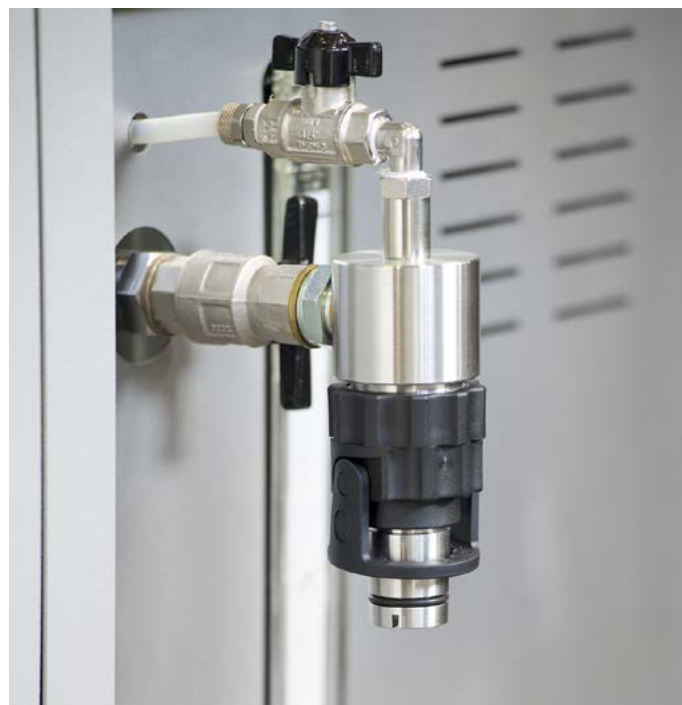
Widok 75-PV5X100 kolba z szybkim montażem do pobierania asfaltu