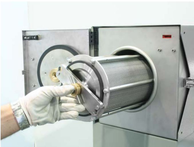
Widok kosza 75-PV5X010