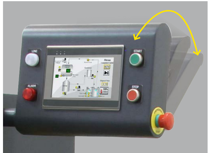
7" Dotykowy wyświetlacz sterujący